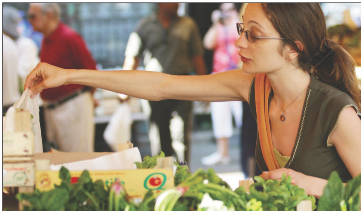
Crescono i gruppi di acquisto solidale: più risparmio e più qualità - A pagina 10